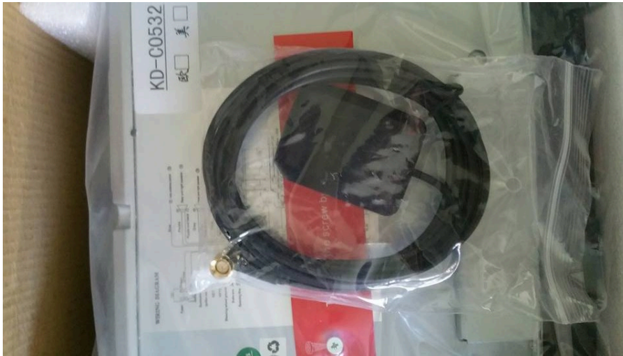
The car stereo itself.