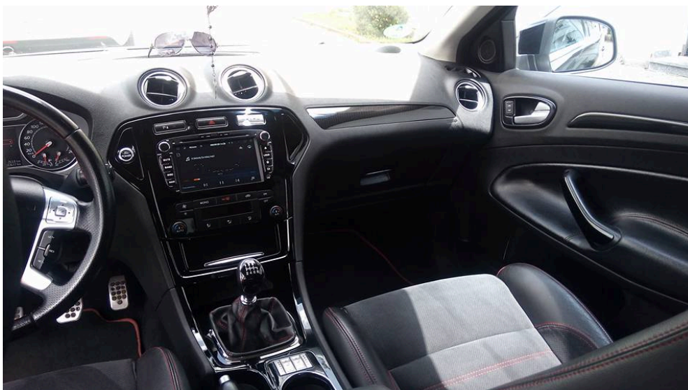
It fits perfectly in my Ford Mondeo.